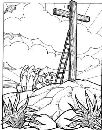
.blokkflwg mennil n'ne rammong skud reuf n'v' sbrow ausat.

Kinderen bovenbouw: Geef ze de kleurplaat van een leeg kerkraam en laat ze aan de ene kant dingen uit het leven van de Heere Jezus tekenen (of schrijven) die deze Zondag noemt en aan de andere kant dingen uit het leven van Gods kinderen die daarbij horen.